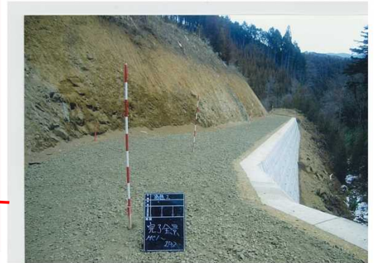
しおのひら 路網整備(いわき市塩ノ平国有林)