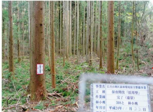
ぶつぐやま 間伐(いわき市仏具山国有林)