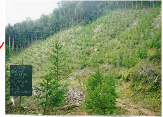
ごしやもり 下刈(双葉郡広野町五社森国有林)