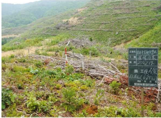
くみに 植付(南相馬市国見国有林)