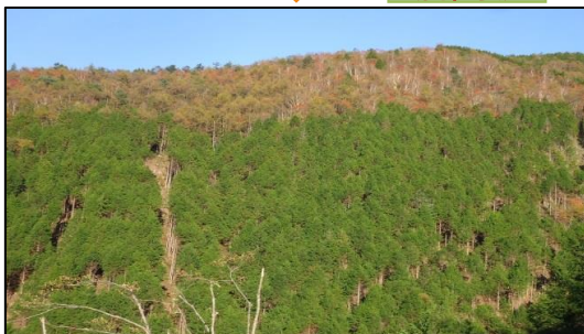
東濃森林管理署 間伐