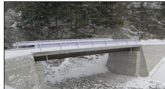
東濃森林管理署 夕森田立(丸野)橋梁架設工事