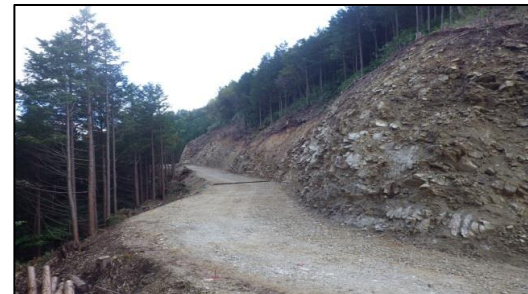
東濃森林管理署 高時山(カシモ谷)林道新設工事