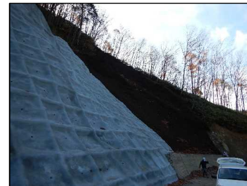
令和4年度 東濃森林管理署 高時山林道改良工事