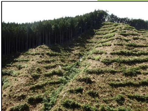
令和4年度 東濃森林管理署 下刈