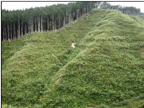
森林整備事業 (下刈作業前)