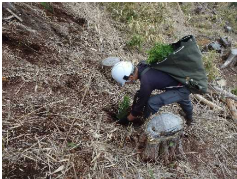
令和4年度 東濃森林管理署 植栽