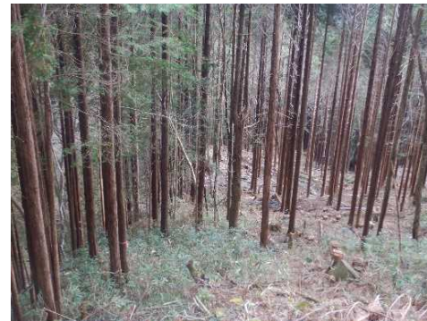
令和4年度 東濃森林管理署 保育間伐