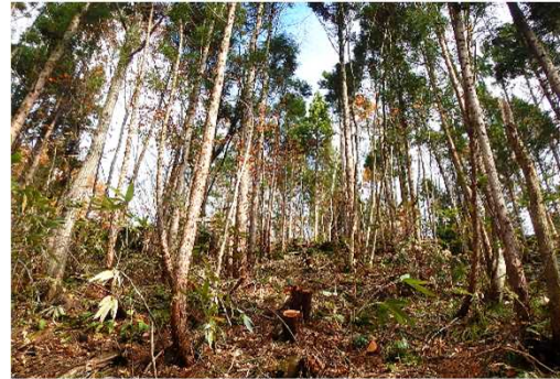
臼ヶ沢国有林（保育間伐）