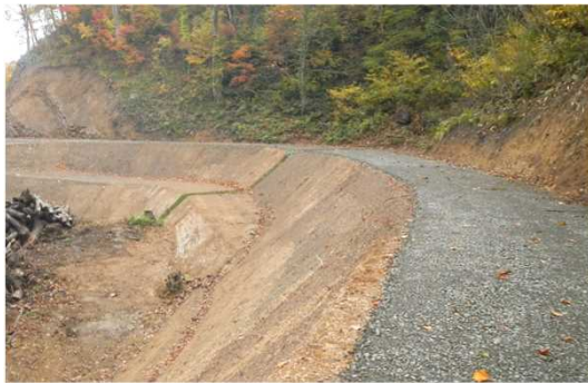
鷹巣沢林道（林業専用道）