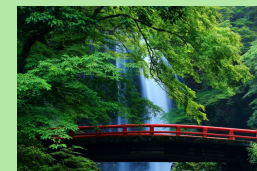
明治の森箕面自然休養林