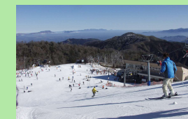
向坂山野外スポーツ地域