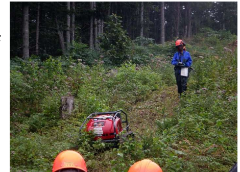
遠隔操作の機能を有する機械による下刈りの実演