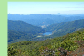
五葉山自然観察教育林