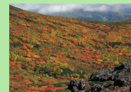
トムラウシ自然休養林