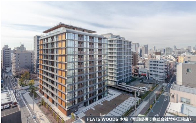
FLATS WOODS 木場