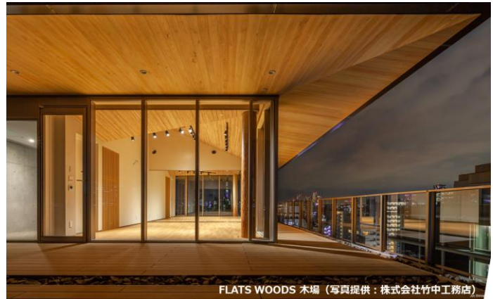
FLATS WOODS 木場