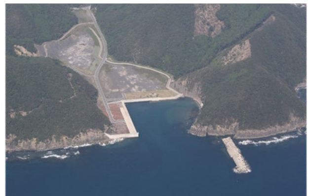
強風や高波で船舶が着岸できない木材積出港

今後、安定的かつ効果的に輸送支援を継続するためには、国・県との役割分担の明確化や、補助制度の恒常化、複数財源の組み合わせによる財政構造の強化が必要となる。加えて、地域内での共同輸送や出荷調整など、コスト削減と財源の有効活用を両立させる運用面での工夫も重要であり、関係機関との連携を深め、地域の実情に即した林業振興に継続して取り組んでいきたい。