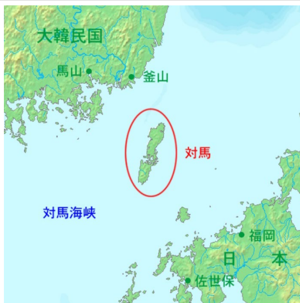
当普及区の位置図

輸送費の負担が重くのしかかることで、素材生産業者の事業継続意欲を削ぐ一因となっており、高コストの影響で伐採後も搬出されず山に残される木材が発生するなど、結果として森林資源の有効活用が進まないという悪循環が生じている。こうしたコスト構造が木材搬出の大きな障壁となっているだけでなく、林業経営全体の採算性に影響を及ぼしている。