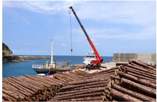
船舶への木材積込の様子

これらに対しては、制度面に加えた中長期的な対応が不可欠であり、海運業者や林業経営者の意見を踏まえ、制度の柔軟な見直しや関係者間の連携強化を図り、より実効性のある支援等の検討が求められる。