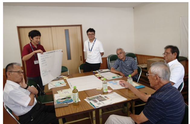
役員ワークショップ実施状況