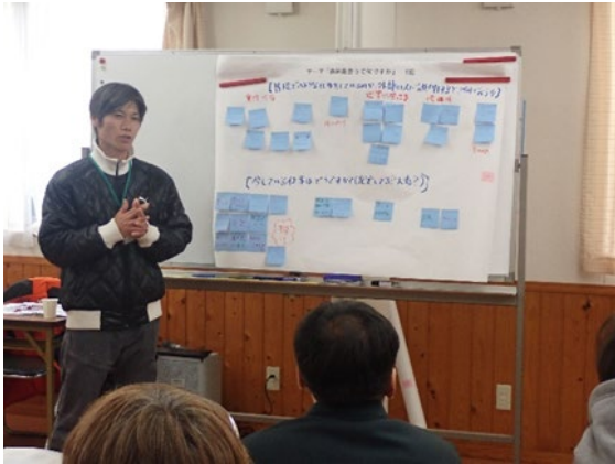
職員ワークショップ実施状況