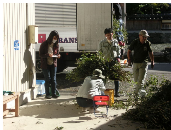
「ウラジログシ出荷状況」