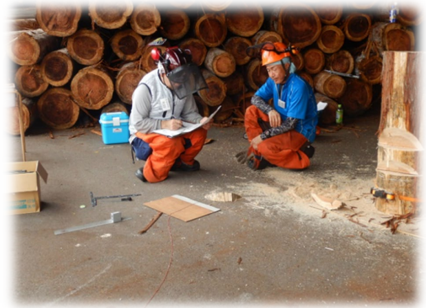
(伐倒技術改善のコーチング練習)