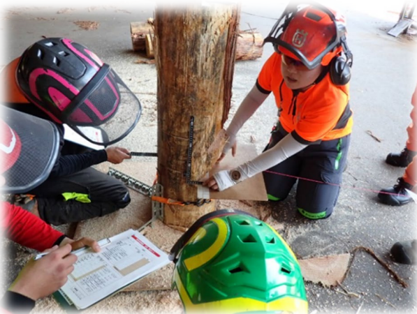
(伐倒時の指導ポイントの説明)

目的：林業現場における持続的な人材育成に必要なリーダーシップ・コーチング能力や課題解決能力等を向上させる。