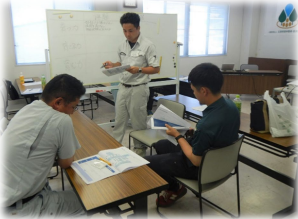
(グループワーク風景)

目的：集約化施業の企画提案(プラン書作成)や計画設計、現場管理に加えて、中長期の経営収支や森林整備の事業計画の立案等に必要な知見を習得する。