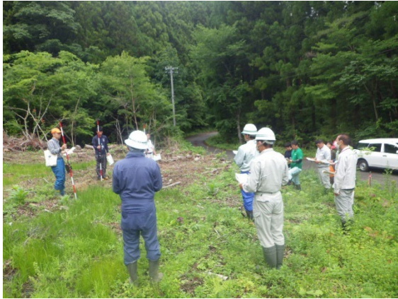
(写真2) GNSS の操作指導