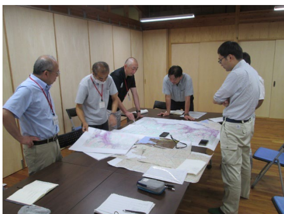
（写真3：方向性の意見交換）

そのため、令和7年7月に釜石市、森林組合及び県で、意向調査により委託を希望された森林を核に、一体的な森林整備、効果的な路網整備など面的かつ中長期的な視点で、地域における森林整備の方向性について意見交換を開始したところである。意見交換では、図面を用いて、委託希望の森林のほか、森林経営計画対象森林、市有林、県行造林等を面的に確認し検討を進めた（写真3）。今後もこの取組を継続し、意見交換や連携を定着させ、森林整備を進める。