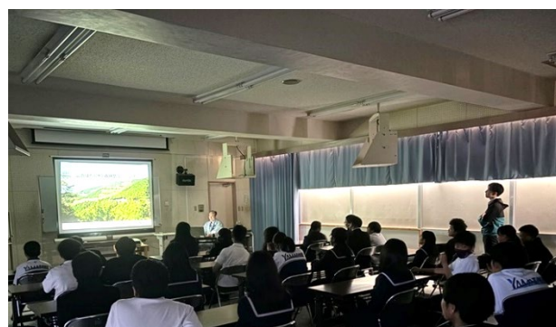
(写真 4 : 出前講座の開催)