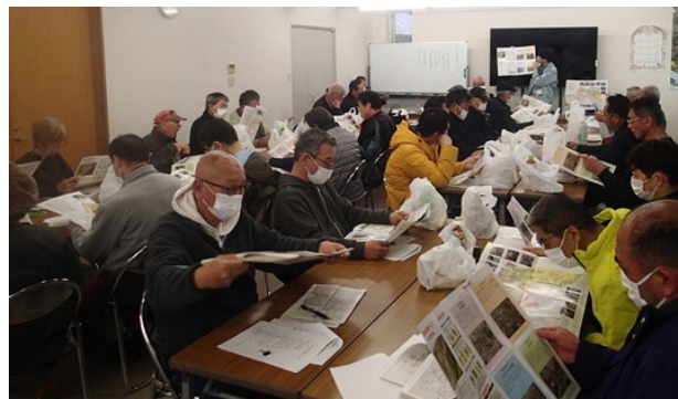
(写真 3 : 防災教室の開催)

また、地元向けの防災教室や出前講座等の開催相談が新たに寄せられるようになり、今後、普及啓発資料やノウハウの共有を図ることで、ソフト対策の普及拡大・連携を進めていきたい。