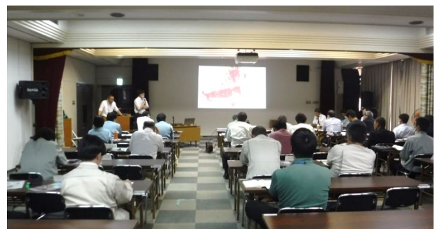
(写真1：森林サポート協議会開催の様子)

従来は、森林整備事業の主な実施主体が大阪府または大阪府森林組合に限られており、大阪府の森林・林業施策の説明・情報共有の場として、管内市町村担当者を集めた森林サポート協議会を開催してきた。内容は譲与税や治山事業、外来生物対策、開発規制など多岐に渡り、大阪府の取組紹介のほか、大阪府森林組合、一般財団法人大阪府みどり公社、大阪府立環境農林水産総合研究所による市町村支援の情報提供など充実を図ってきたが、年度当初の概要説明にとどまり、森林環境譲与税の導入以降、森林整備の実施主体に加わる市町村の個別調整の必要性が高まっていた。