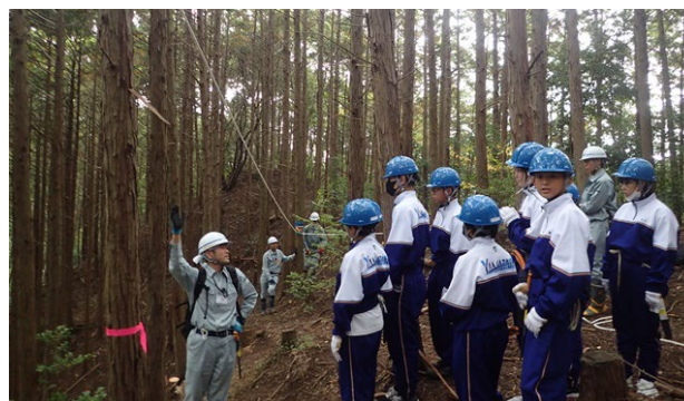
(写真 5 : 間伐体験)