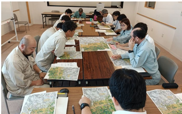
(写真 2 : 森林区域図を使用した事業箇所の共有)

の用途や計画のヒアリング、指導・助言を行うとともに、大阪府・市町・森林組合の森林整備事業計画を共有・調整した。森林サポート協議会との主な違いとして、市町ごとの開催、府・市町双方からの取組説明、市町ごとの森林区域図に事業予定箇所を記載し共有、譲与税及び森林整備の取組みに焦点、が挙げられる。