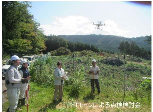
ドローンによる点検検討会

双眼鏡を使用した点検は、離れた場所から柵や植栽木の状況を確認できるため、特に急傾斜地での点検に適している。ドローンを活用した点検では上空から施行地全体の状況を俯瞰的に把握することが可能であるといことと双眼鏡を使用した時と同様に柵や植栽木の状況を確認できるため急傾斜地や広範囲の面積を効率よく確認する際に有効であった。ただし、詳細な部分までは目視による方法が優れているため、今後の検討が必要である。