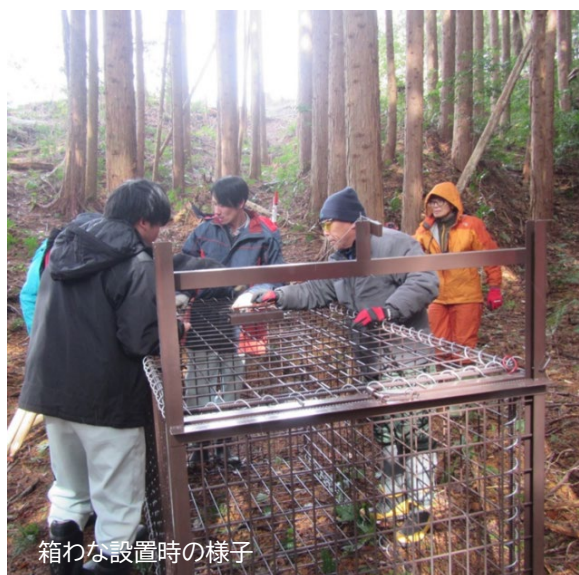
箱わな設置時の様子

伐・再生林の現場において、市の有害鳥獣被害対策の一環として箱わなを設置し、シカの捕獲を行っている。この取り組みは、栗東市における農業被害に対する有害鳥獣被害対策の経験を活かしたものであり、林業被害への対策としては今回が初めての試みとなっている。