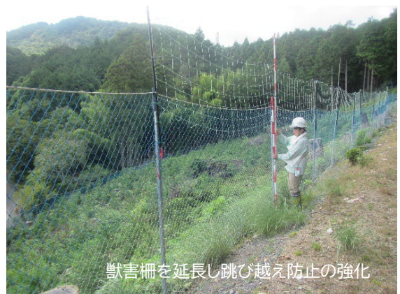
獣害柵を延長し跳び越え防止の強化

まず、飛び越えの防止については、シカが柵を飛び越えないよう、高さ1.8m以上のネットを