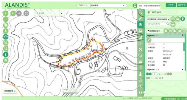
森林クラウドによる情報共有

点検履歴については、令和7年度から滋賀県で導入された森林クラウド上で県、市、森林組合で獣害柵の点検状況の共有を行う取り組みを始めている。市や県の担当者が代わってもクラウド上に点検履歴が残っていることで引き継ぎがスムーズに行われることが期待される。