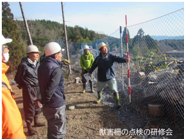
獣害柵の点検の研修会

防護柵の点検管理においては、森林所有者、森林組合職員、市職員、県普及職員が共通の視点で実施できるよう、チェックリストを作成し、点検研修会を開催した。点検は原則として2か月に1回程度の頻度で行い、大雨や強風の後には随時現地で状況を確認し、情報を共有している。