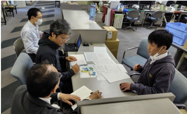
写真2 県AG、アドバイザーによる支援の様子

※「ふじのくに森林整備アドバイザー」：森林・林業に関する知識・経験を持った人材を、市町からの支援希望に応じて派遣し、市町が実施する森林環境譲与税の事業や森林経営管理制度の運用を支援する、本県独自の制度。