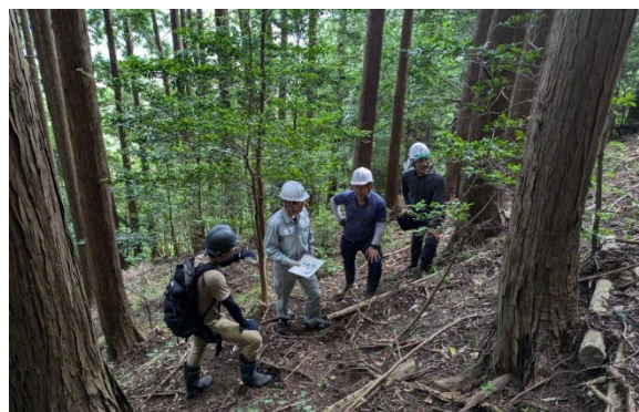
写真1 現地調査の様子

集積計画の公告を終えた森林の間伐を市が発注するに当たり、業者の選定方法に係る助言、設計・積算を簡単に行える支援ツール（チャートに従って面積等を入力すると設計書が出来上がるエクセル）の提供、現地調査への同行・助言などを行った（写真1）。