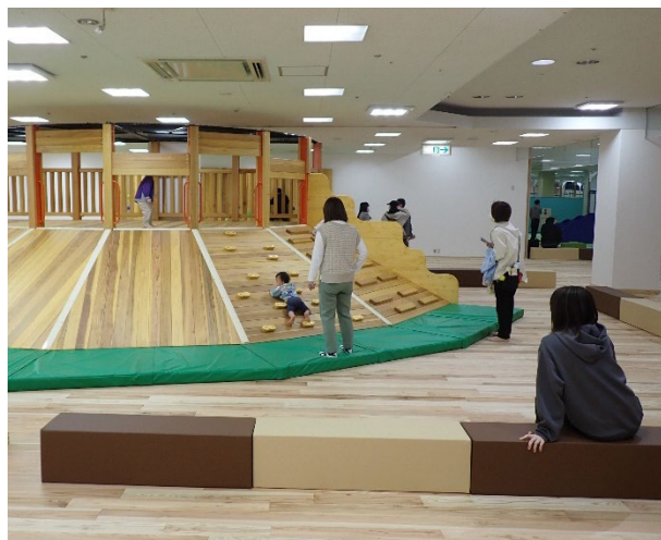
市営の子ども遊び場施設における市産材活用