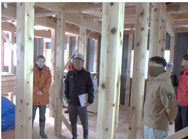
市産材を利用した住宅の上棟研修会

活用した現地研修会等に参加することで、具体的にどのような仕事をしているか相互理解を深め、木材利用拡大に向けた連携強化を推進した。