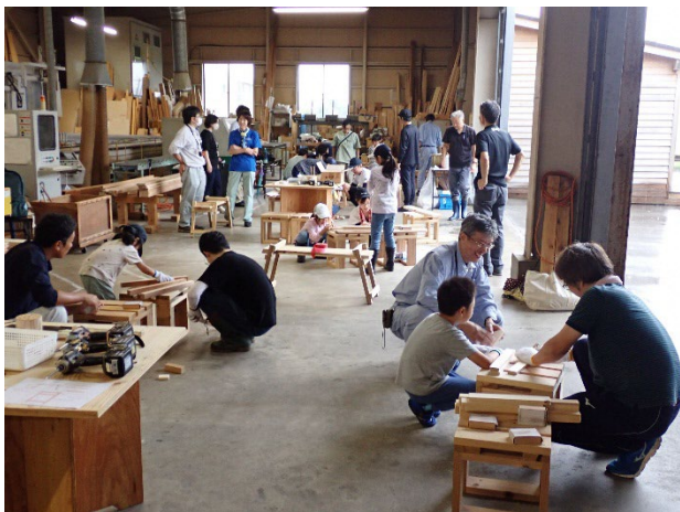
親子森林体験会における木工体験