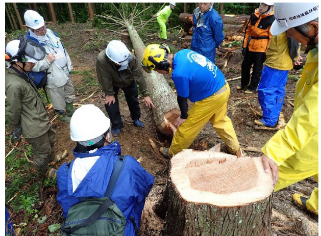
主伐再造林現場で行った造材研修