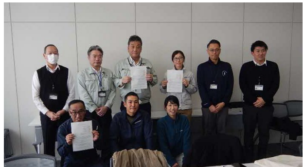
写真5 今後も地域関係者と連携を図りながら

関係者が連携して作成した森林経営計画が土台となり、地域全体の森林整備の底上げが期待される。今後も市をはじめ、地域関係者と試行錯誤をしながら、地道に普及指導に取り組んでいく。[写真5]