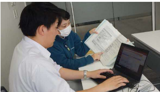
写真3 実際のシステムを使った個別支援

集団研修で基礎的な知識を深めた後、個別に丁寧な支援を行ったことにより、林務経験が浅い市町村職員等の森林経営計画に係る習熟度が増し、スキルアップに繋がった。