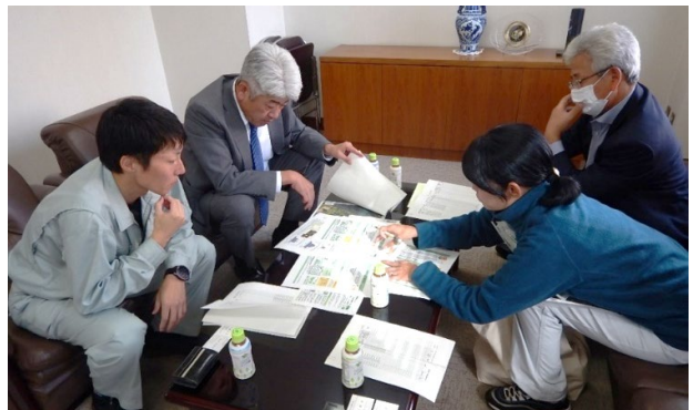
写真4 林家訪問による森林経営計画参画の働きかけ

既存の森林経営計画からさらに認定面積を増やすため、札幌市森林組合と連携し、林家訪問による新たな森林所有者の掘り起こしを行った。[写真4]