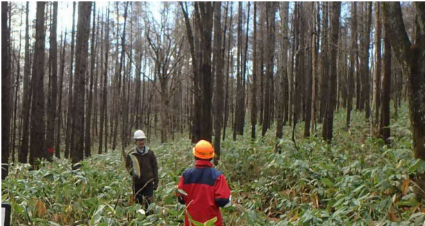
写真2 現地確認による事業実施箇所の決定

所の現況や路網状況などを確認し、間伐する箇所を決定した。また、職員の入れ替わりにより初めて事務に携わる担当職員に対し、森林経営計画の作成方法やシステムの使い方などの個別支援を実施した。[写真2]