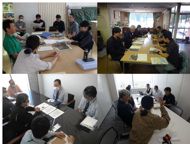
写真1 地域の関係機関で取組の方向性を検討

森林経営計画の認定者である北広島市、作成主体である森林組合、北海道などの関係機関で何度も打合せを重ね、次の3つの取組を行った。[写真1]