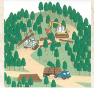
適切に森林整備を推進！

ことから、森林の土地の所有者の把握を進めるため、平成24年4月から森林法に基づく森林の土地の所有者となった旨の届出制度が創設されました。なお、この届出により、森林の土地の所有権の帰属が確定されるものではありません。