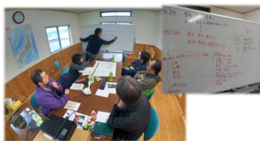
図表 6-2 人材育成研修風景

であり、限られた人員で生産性向上を図るとい意識改革は、これからの林業分野で必要な考え方であり、他地域でも参考になると思われる。