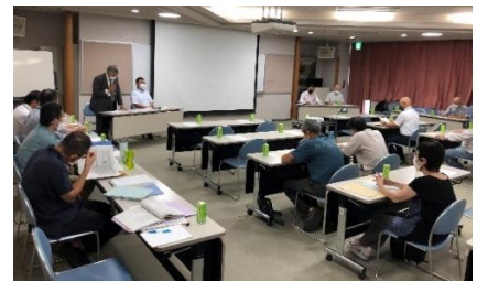
図2 森林経営管理制度説明会