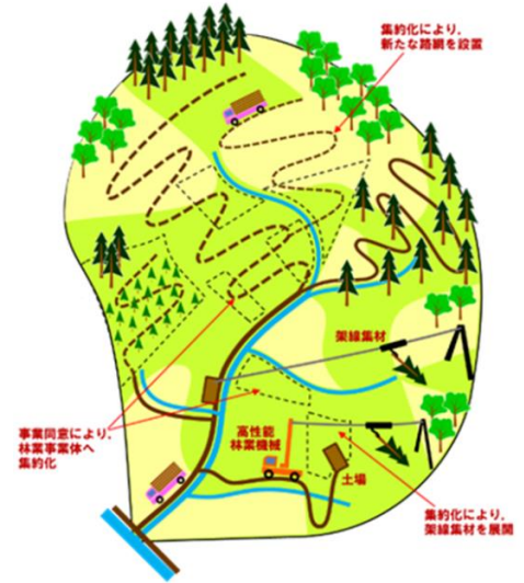
図1 集約化により全ての人工林が管理されている状態

○森林組合をはじめ、民間的林業事業者と市の役割を再確認し、互いを補う仕組みづくりが必要。行政がサポート役となり、民間的林業事業者の育成と経営管理しやすい条件整備を進めることが重要になります。