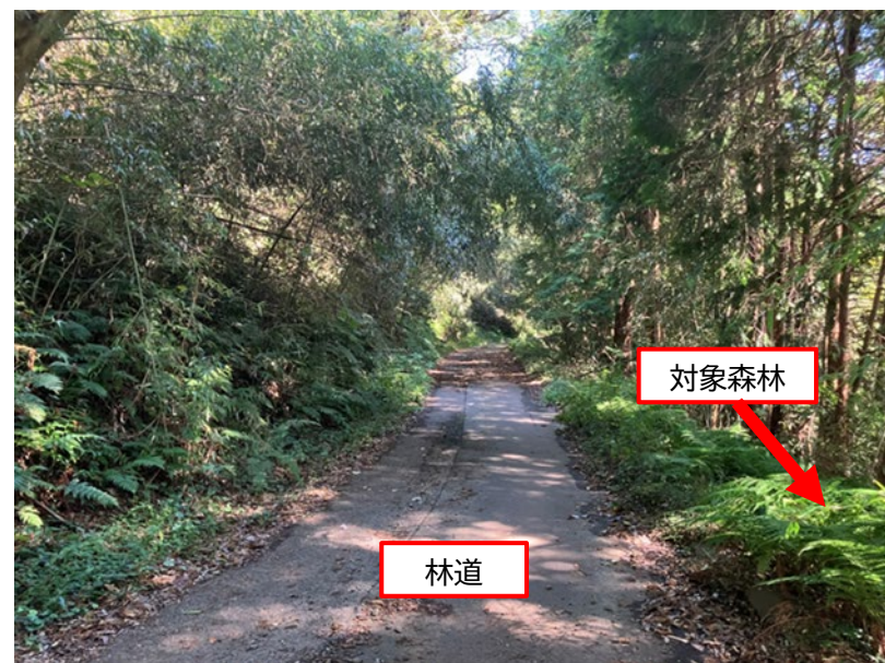
図2 現地林道の状況写真