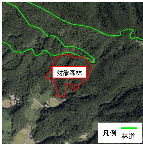
図1 対象森林空中写真（地理院地図）