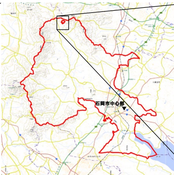
図2 大增共有林の位置