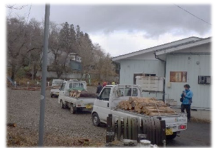
(木の駅プロジェクトによる林地残材活用)