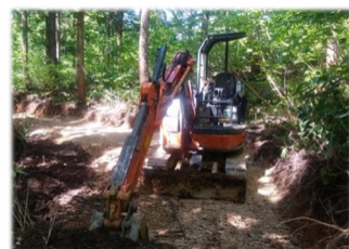
(自身の森林整備作業)