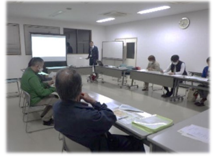
(林業事業者との連携)