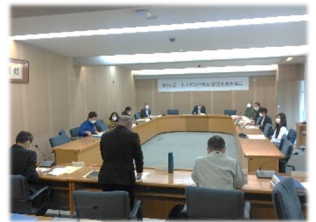
(掛川市森林経営管理推進協議会)