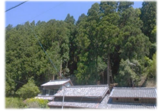
(おかえり「森林」総合対策事業による整備前)