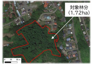
(所有者不明森林特例措置の対象林分)