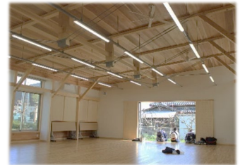
同上 (木材活用促進)