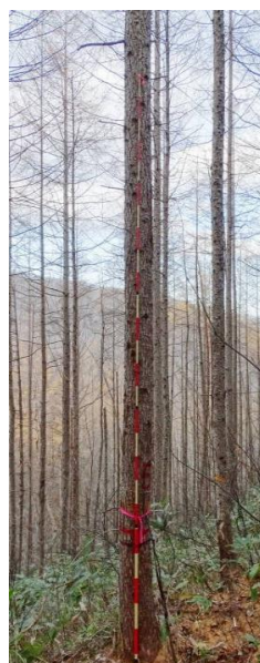
指定番号 特定1 -14 名称 カラマツ東育2-37 樹種 カラマツ 所有者 林木育種センター東北育種場