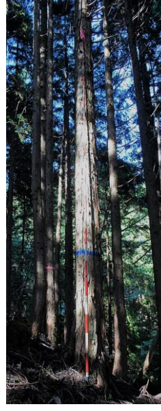
指定番号 特定1 -33 名称 ヒノキ西育2-105 樹種 ヒノキ 所有者 林木育種センター関西育種場