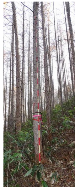
指定番号 特定1 -13 名称 カラマツ東育2-35 樹種 カラマツ 所有者 林木育種センター東北育種場