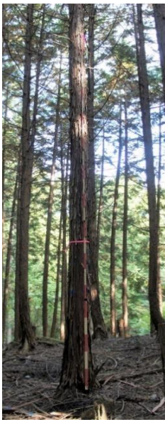
指定番号 特定1 -6 名称 ヒノキ西育2-276 樹種 ヒノキ 所有者 林木育種センター関西育種場