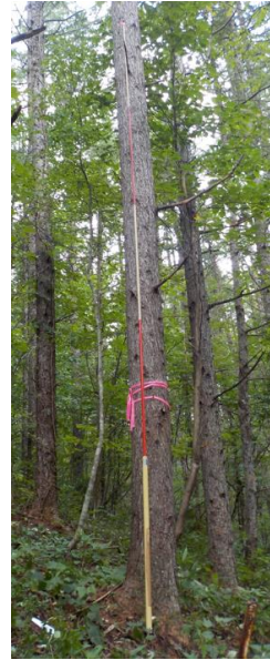
指定番号 特定1 -24 名称 カラマツ林育2-204 樹種 カラマツ 所有者 林木育種センター