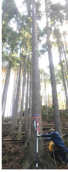
指定番号 特定1 -37 名称 天竜217号 樹種 スギ 所有者 静岡県