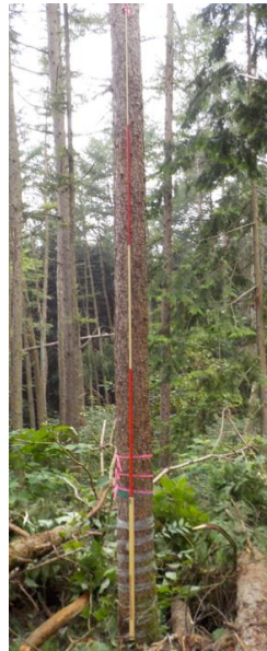
指定番号 特定1 -22 名称 カラマツ林育2-199 樹種 カラマツ 所有者 林木育種センター