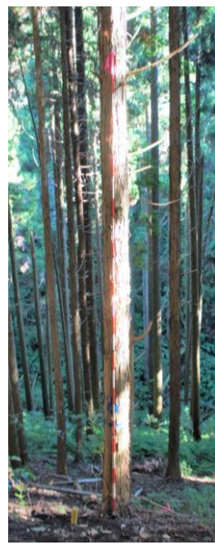
指定番号 特定1 -32 名称 ヒノキ西育2-104 樹種 ヒノキ 所有者 林木育種センター関西育種場