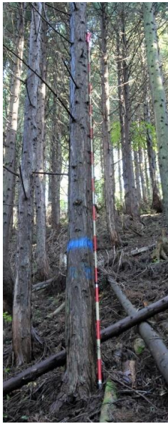
指定番号 特定1 -36 名称 ヒノキ西育2-125 樹種 ヒノキ 所有者 林木育種センター関西育種場