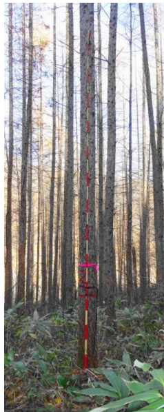
指定番号 特定1 -12 名称 カラマツ東育2-32 樹種 カラマツ 所有者 林木育種センター東北育種場