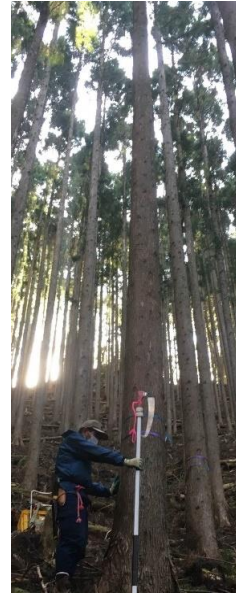
指定番号 特定1 -38 名称 天竜218号 樹種 スギ 所有者 静岡県