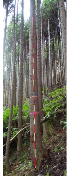
指定番号 特定1 -30 名称 スギ東育2-391 樹種 スギ 所有者 林木育種センター-東北育種場