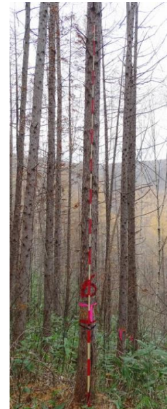
指定番号 特定1 -15 名称 カラマツ東育2-38 樹種 カラマツ 所有者 林木育種センター東北育種場