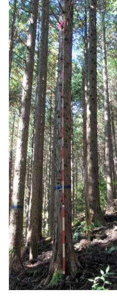
指定番号 特定1 -35 名称 ヒノキ西育2-108 樹種 ヒノキ 所有者 林木育種センター関西育種場