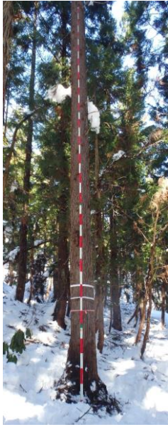
指定番号 特定1 -16 名称 153雄勝10-10号 樹種 スギ 所有者 秋田県