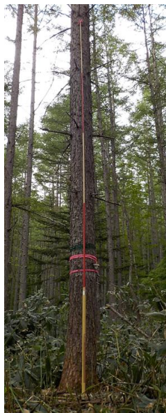
指定番号 特定1 -28 名称 カラマツ林育2-213 樹種 カラマツ 所有者 林木育種センター