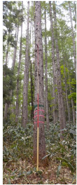
指定番号 特定1 -25 名称 カラマツ林育2-206 樹種 カラマツ 所有者 林木育種センター