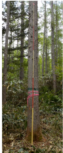
指定番号 特定1 -27 名称 カラマツ林育2-209 樹種 カラマツ 所有者 林木育種センター