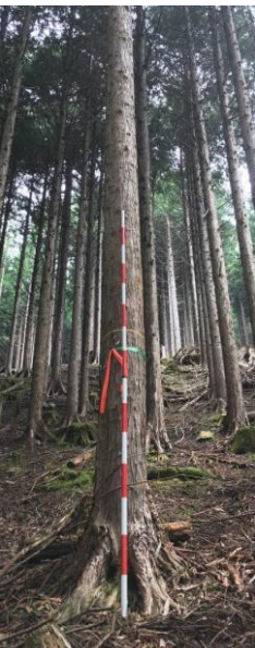
指定番号 特定1 -41 名称 安倍22号 樹種 ヒノキ 所有者 静岡県