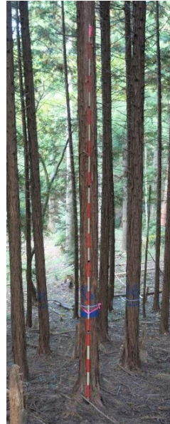
指定番号 特定1 -3 名称 ヒノキ西育2-270 樹種 ヒノキ 所有者 林木育種センター関西育種場