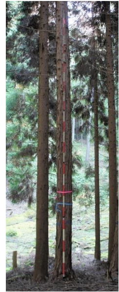
指定番号 特定1 -5 名称 ヒノキ西育2-273 樹種 ヒノキ 所有者 林木育種センター関西育種場