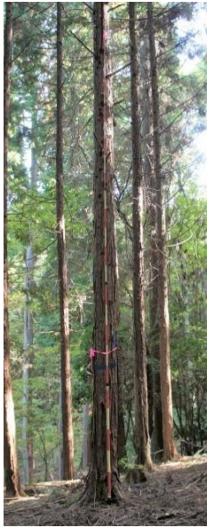
指定番号 特定1 -1 名称 ヒノキ西育2-266 樹種 ヒノキ 所有者 林木育種センター関西育種場