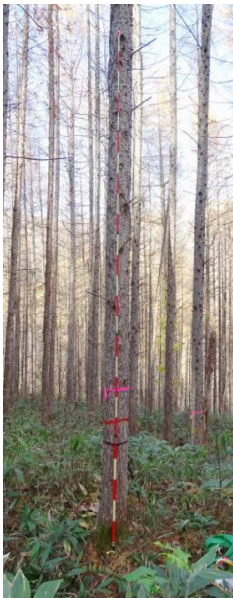
指定番号 特定1 -11 名称 カラマツ東育2-31 樹種 カラマツ 所有者 林木育種センター東北育種場