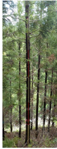
指定番号 特定1 -18 名称 スギ林育2-354 樹種 スギ 所有者 林木育種センター