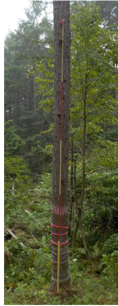
指定番号 特定1 -23 名称 カラマツ林育2-201 樹種 カラマツ 所有者 林木育種センター