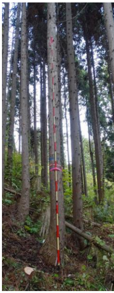
指定番号 特定1 -31 名称 スギ東育2-392 樹種 スギ 所有者 林木育種センター東北育種場