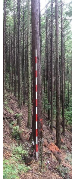
指定番号 特定1 -9 名称 天竜26号 樹種 ヒノキ 所有者 静岡県