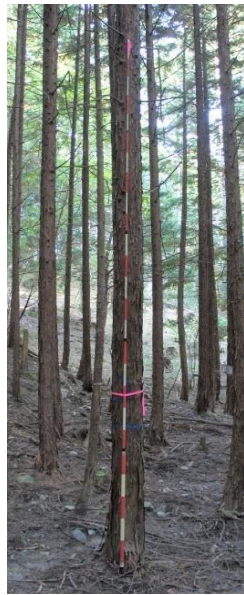
指定番号 特定1 -2 名称 ヒノキ西育2-268 樹種 ヒノキ 所有者 林木育種センター関西育種場