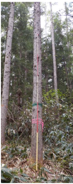
指定番号 特定1 -26 名称 カラマツ林育2-207 樹種 カラマツ 所有者 林木育種センター