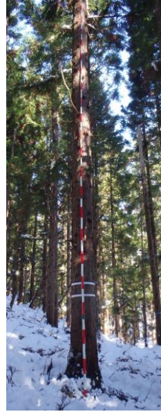
指定番号 特定1 -17 名称 153平鹿3-3号 樹種 スギ 所有者 秋田県