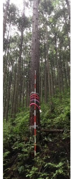
指定番号 特定1 -10 名称 天竜27号 樹種 ヒノキ 所有者 静岡県