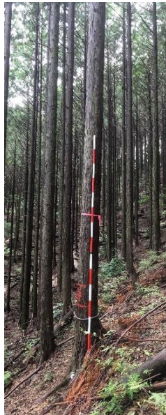
指定番号 特定1 -8 名称 天竜25号 樹種 ヒノキ 所有者 静岡県