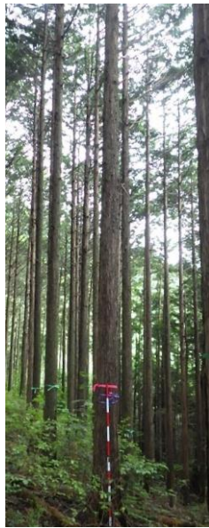
指定番号 特定1 -42 名称 安倍26号 樹種 ヒノキ 所有者 静岡県