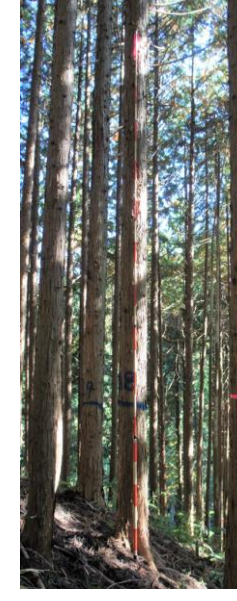
指定番号 特定1 -34 名称 ヒノキ西育2-107 樹種 ヒノキ 所有者 林木育種センター関西育種場