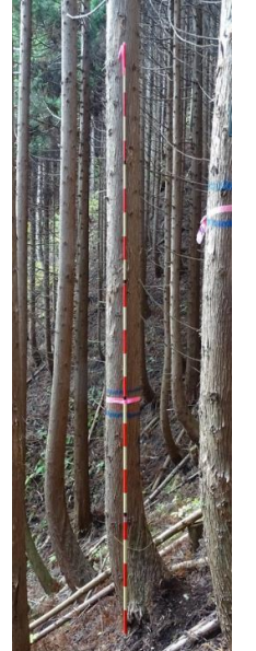
指定番号 特定1 -29 名称 スギ東育2-387 樹種 スギ 所有者 林木育種センター-東北育種場