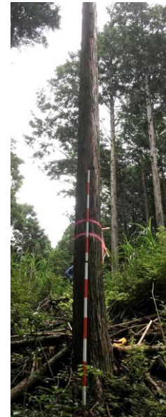
指定番号 特定1 -39 名称 大井21号 樹種 ヒノキ 所有者 静岡県