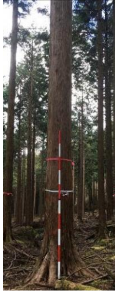
指定番号 特定1 -43 名称 富士27号 樹種 ヒノキ 所有者 静岡県