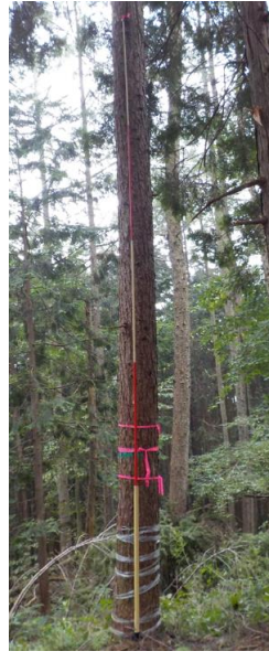
指定番号 特定1 -19 名称 カラマツ林育2-195 樹種 カラマツ 所有者 林木育種センター