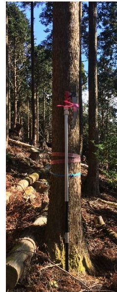
指定番号 特定1 -7 名称 伊豆23号 樹種 スギ 所有者 静岡県