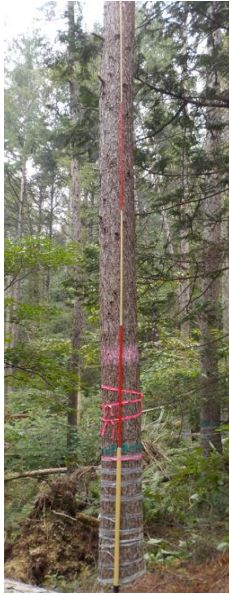
指定番号 特定1 -21 名称 カラマツ林育2-197 樹種 カラマツ 所有者 林木育種センター