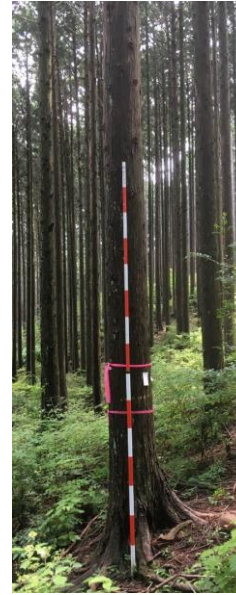
指定番号 特定1 -40 名称 大井22号 樹種 ヒノキ 所有者 静岡県