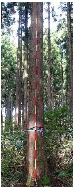
指定番号 特定3 -37 名称 スギ東育山県2-538 樹種 スギ 所有者 山形県・東北育種場