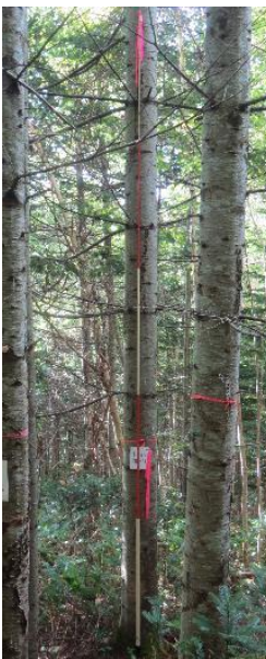
指定番号 特定3 -7 名称 トドマツ北育2-94 樹種 トドマツ