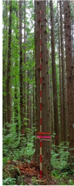
指定番号 特定3 -33 名称 スギ東育宮県2-534 樹種 スギ 所有者 宮城県・林木育種センター