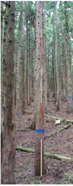
指定番号 特定3 -13 名称 スギ西育2-251 樹種 スギ