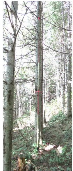
指定番号 特定3 -5 名称 トドマツ北育2-77 樹種 トドマツ