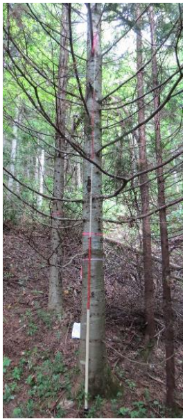
指定番号 特定3 -6 名称 トドマツ北育2-88 樹種 トドマツ