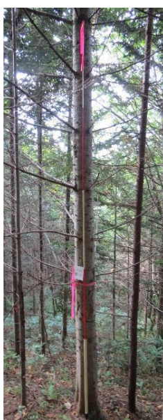
指定番号 特定3 -8 名称 トドマツ北育2-102 樹種 トドマツ