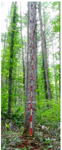
指定番号 特定3 -26 名称 カラマツ東育2-33 樹種 カラマツ 所有者 林木育種センター東北育種場