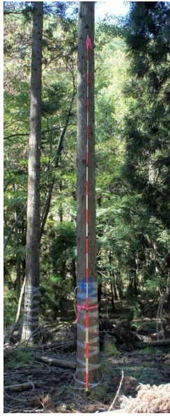
指定番号 特定3 -17 名称 スギ西育2-264 樹種 スギ 所有者 林木育種センター関西育種場