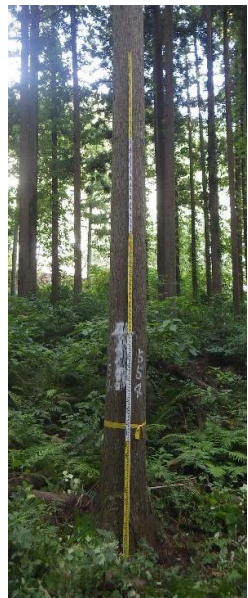
指定番号 特定3 -24 名称 島根隠岐554号 樹種 スギ 所有者 島根県