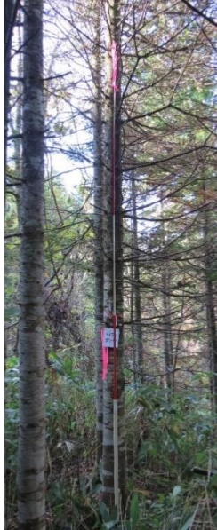
指定番号 特定3 -2 名称 トドマツ北育2-62 樹種 トドマツ