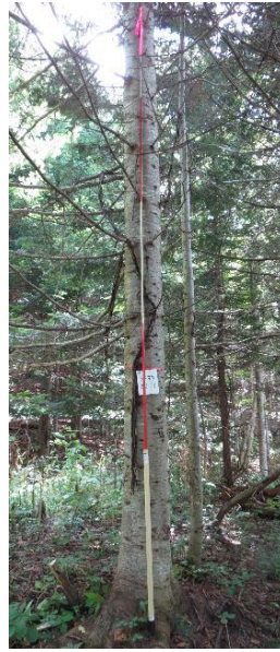
指定番号 特定3 -4 名称 トドマツ北育2-72 樹種 トドマツ