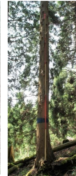
指定番号 特定3 -14 名称 スギ西育2-256 樹種 スギ