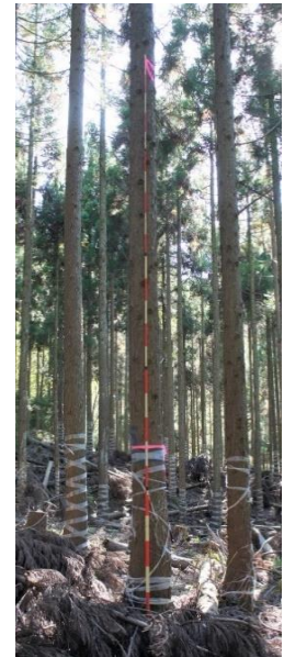
指定番号 特定3 -20 名称 スギ西育2-273 樹種 スギ 所有者 林木育種センター関西育種場