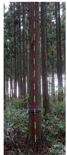
指定番号 特定3 -35 名称 スギ東育山県2-536 樹種 スギ 所有者 山形県・東北育種場