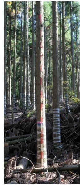
指定番号 特定3 -30 名称 スギ西育2-268 樹種 スギ 所有者 林木育種センター関西育種場