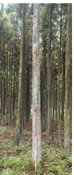
指定番号 特定3 -10 名称 スギ林育2-204 樹種 スギ