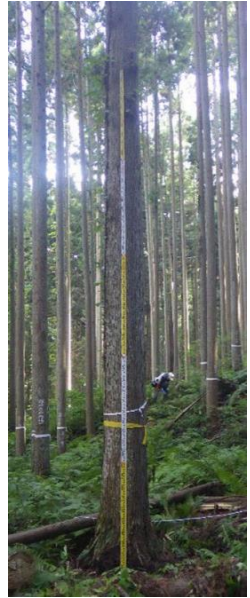
指定番号 特定3 -23 名称 島根隠岐553号 樹種 スギ 所有者 島根県