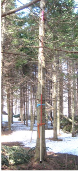
指定番号 特定3 -1 名称 トドマツ北育2-25 樹種 トドマツ