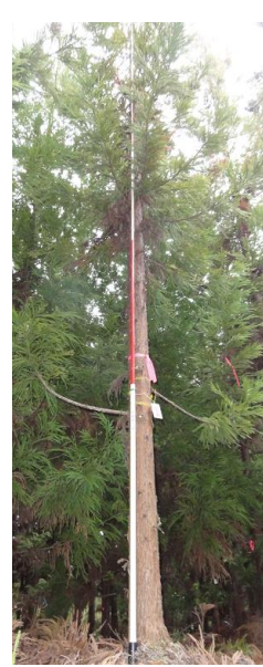
指定番号 特定3 -43 名称 スギ林育2-221 樹種 スギ 所有者 林木育種センター