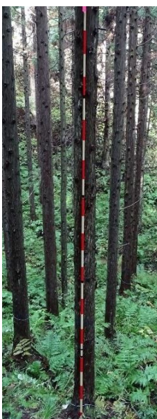
指定番号 特定3 -41 名称 スギ東育山県耐雪2-542 樹種 スギ 所有者 山形県・東北育種場