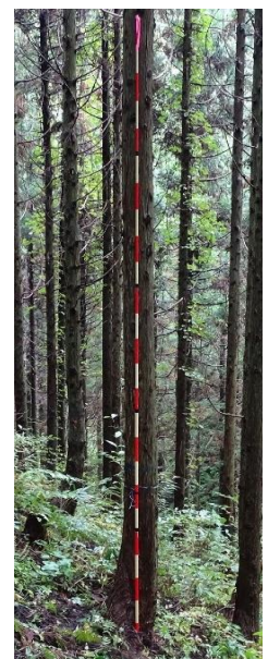
指定番号 特定3 -40 名称 スギ東育山県耐雪2-541 樹種 スギ 所有者 山形県・東北育種場