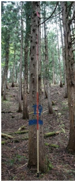
指定番号 特定3 -16 名称 スギ西育2-258 樹種 スギ 所有者 林木育種センター関西育種場