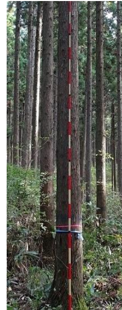
指定番号 特定3 -38 名称 スギ東育山県2-539 樹種 スギ 所有者 山形県・東北育種場