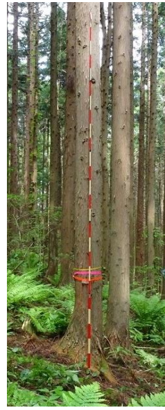
指定番号 特定3 -34 名称 スギ東育宮県2-535 樹種 スギ 所有者 宮城県・林木育種センター