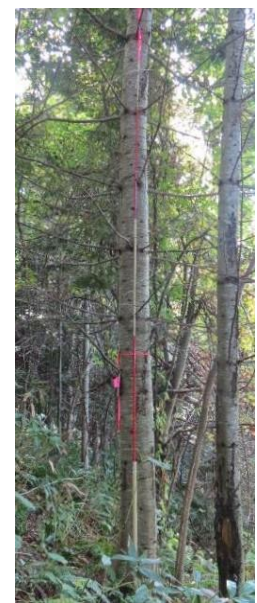
指定番号 特定3 -9 名称 トドマツ北育2-105 樹種 トドマツ