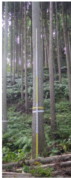
指定番号 特定3 -32 名称 島根隠岐721号 樹種 スギ 所有者 島根県