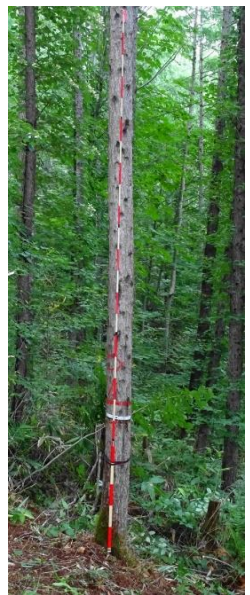
指定番号 特定3 -28 名称 カラマツ東育2-41 樹種 カラマツ 所有者 林木育種センター東北育種場