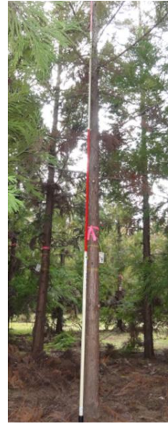
指定番号 特定3 -42 名称 スギ林育2-196 樹種 スギ 所有者 林木育種センター