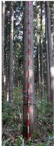
指定番号 特定3 -36 名称 スギ東育山県2-537 樹種 スギ 所有者 山形県・東北育種場