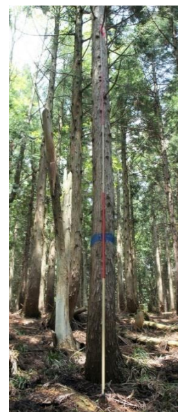
指定番号 特定3 -11 名称 スギ西育2-249 樹種 スギ