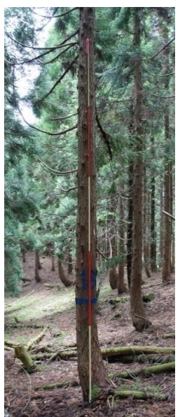
指定番号 特定3 -15 名称 スギ西育2-257 樹種 スギ