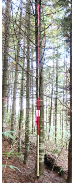
指定番号 特定3 -3 名称 トドマツ北育2-63 樹種 トドマツ