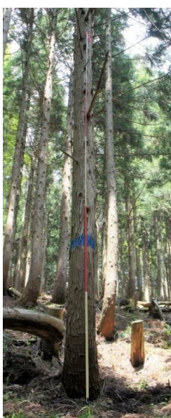
指定番号 特定3 -12 名称 スギ西育2-250 樹種 スギ