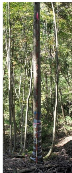
指定番号 特定1 -18 名称 スギ西育2-265 樹種 スギ 所有者 林木育種センター関西育種場