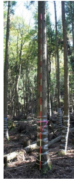
指定番号 特定3 -19 名称 スギ西育2-270 樹種 スギ 所有者 林木育種センター関西育種場