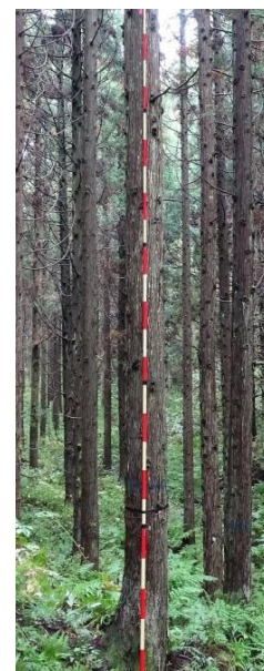
指定番号 特定3 -39 名称 スギ東育山県耐雪2-540 樹種 スギ 所有者 山形県・東北育種場