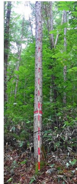
指定番号 特定3 -29 名称 カラマツ東育2-43 樹種 カラマツ 所有者 林木育種センター東北育種場