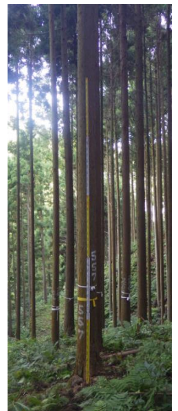
指定番号 特定3 -25 名称 島根隠岐557号 樹種 スギ 所有者 島根県