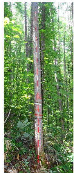
指定番号 特定3 -27 名称 カラマツ東育2-36 樹種 カラマツ 所有者 林木育種センター東北育種場