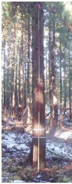
指定番号 特定3 -31 名称 251雄勝16-10号 樹種 スギ 所有者 秋田県