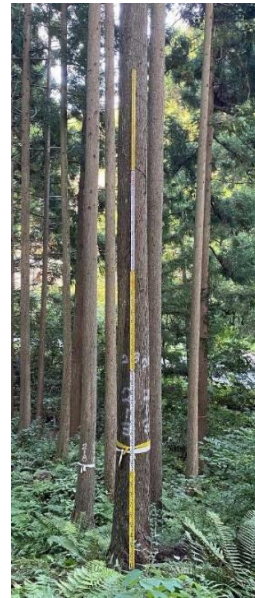
指定番号 特定3 -22 名称 島根隠岐213号 樹種 スギ 所有者 島根県