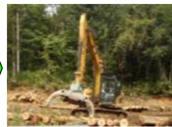
【グラップルによる巻立て】