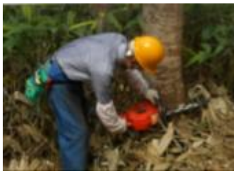
【チェーンソーによる伐倒】