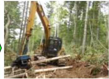
【ハーベスタによる枝払い・玉切り】