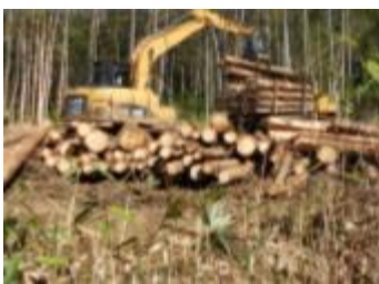
【グラップルによる積込み】