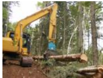
【グラップルによる木寄せ・集積】