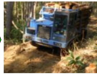
【クローラダンプによる集材】