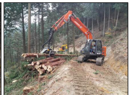
【プロセッサ 枝払・玉切】