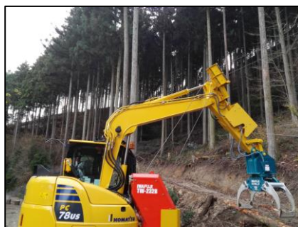
【スイングヤーダ 集材】