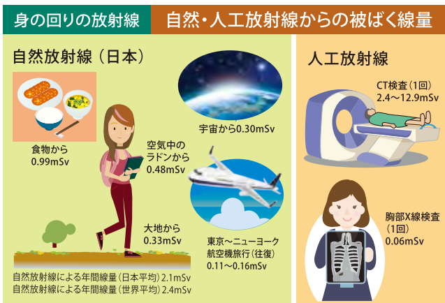
図 身の回りの放射線

放射線による発がんリスクの増加は、100mSv以下の低線量被ばくでは、喫煙等の他の要因による発がんリスクに隠れてしまうほど小さく、放射線による発がんリスクの明らかな増加を証明することは難しいとされています(表、図)。