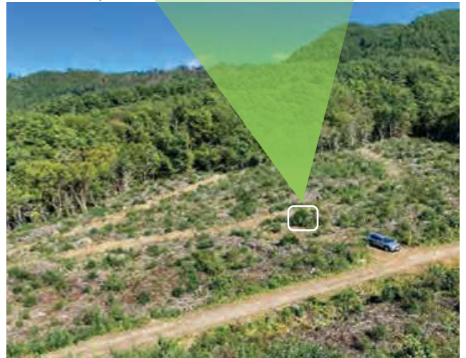
写真2 伐採後のぼう芽更新

また、原発事故以後、福島県だけでなく放射性物質の影響が比較的小さい地域においても、指標値を超える原木林が見受けられたことから、これらの地域でも原木の生産量が落ち込んでいます。