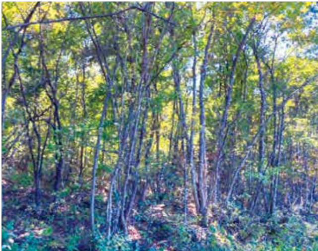
写真1 原木林の成林