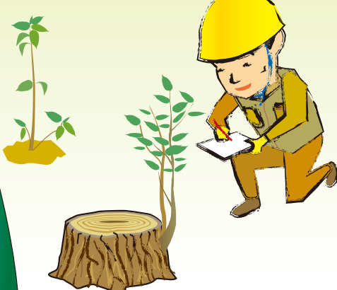
植栽木や萌芽枝の測定