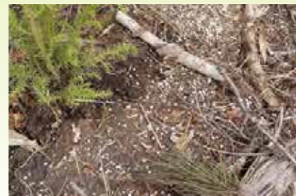
植栽木中の放射性セシウム吸収抑制効果の把握