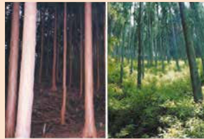
間伐による土砂移動抑制効果の検証 (放射性セシウムの拡散を抑制)