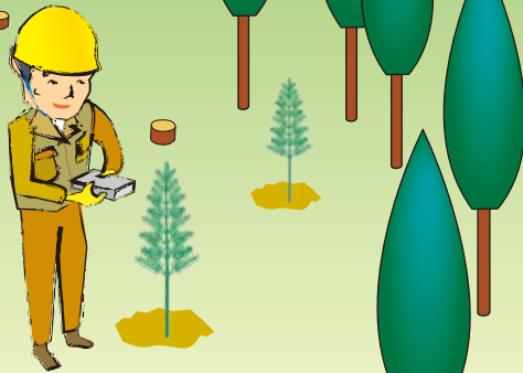
間伐・皆伐・植栽箇所での空間線量率測定