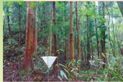
樹木から新たに落ちてくる葉枝等の測定