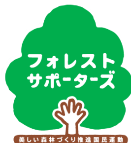
美しい森林づくり