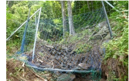
（写真 1：早期復旧した『受け流す柵』）

『受け流す柵』は金網柵やネット柵にかかわらず、仕様書にある資材で設置ができる簡易な構造のため、大雨後の点検時にその場で修繕が可能であることのメリットは大きく、早期に柵を復旧することでシカの侵入を防ぐことが可能となります。（写真 1）