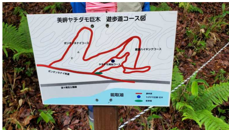
美岬のヤチダモ 遊歩道コース

当センターでは、地域の各機関と連携した森林とのふれあい活動に取り組んでおりますので、ご要望がありましたらお気軽にご連絡ください。