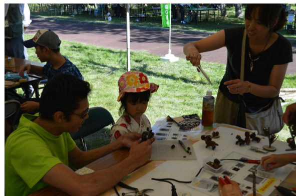
おいぬさんできたかな？