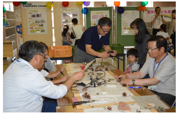
網走中部署長も熱血指導中