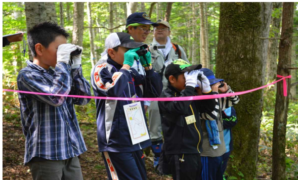
双眼鏡を使って動物（カード）さがし

午後からは、「森の家」の裏の小川で北見市の職員とサイエンスクラブが担当して、子どもたちが採取した魚や水生昆虫などの水生生物を顕微鏡や図鑑で確認し、小川に多くの生物がいることを確認しました。