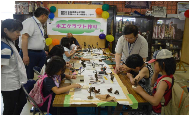
子どもたちで大賑わい

「竹とんぼ・木工クラフトづくり」コーナーは、多くの家族連れが訪れ、作った力作に、子どもたちからは、「とても楽しかったです。」「かわいいのが作れた。お部屋に飾りたい。」「また、来て作って遊びたい。」など大変好評でした。