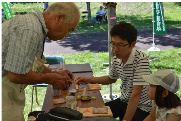
なつかしい竹とんぼづくり