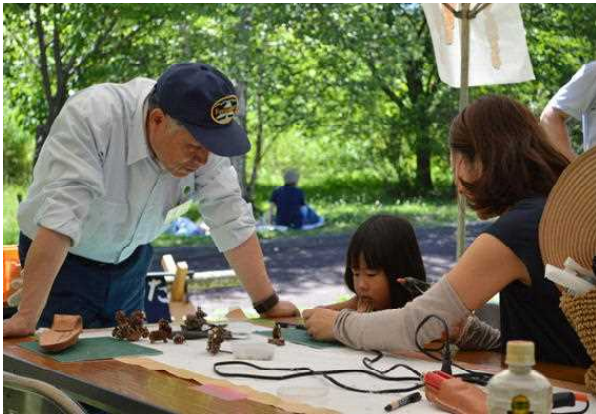
木工クラフト製作中

屋外でのイベントですが両日とも気温が高く、特に29日は35度を超える猛暑日となり、教える方も教わる方も汗だくになりながら好評のうちに終了しました。