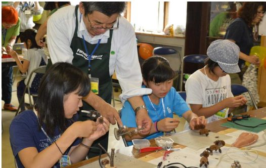
うまくできるかな？

「竹とんぼ・木工クラフトづくり」コーナーは、多くの家族連れが訪れ、作った力作に、子どもたちからは、「とても楽しかったです。」「かわいいのが作れた。お部屋に飾りたい。」「また、来て作って遊びたい。」など大変好評でした。