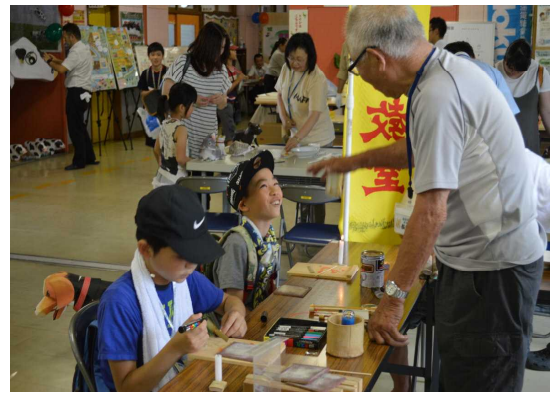
竹とんぼづくりで笑顔

この催しは、北海道農政事務所北見地域拠点と国有林(網走南部森林管理署、網走中部森林管理署、常呂川森林ふれあい推進センター)が、農林水産業への理解を深めてもらうことを目的に行ったもので、当日は、ヒンメリ作り(小麦のワラを使った立体アート)やタマネギでの染色、牛の模型を使った搾乳体験、つりゲーム、農産物のパネルクイズなどが行われ、当センターは、森林ボランティア「オホーツクの会」の協力を得て、竹とんぼとマツボックリのクラフト作り、丸太伐り体験などを行いました。