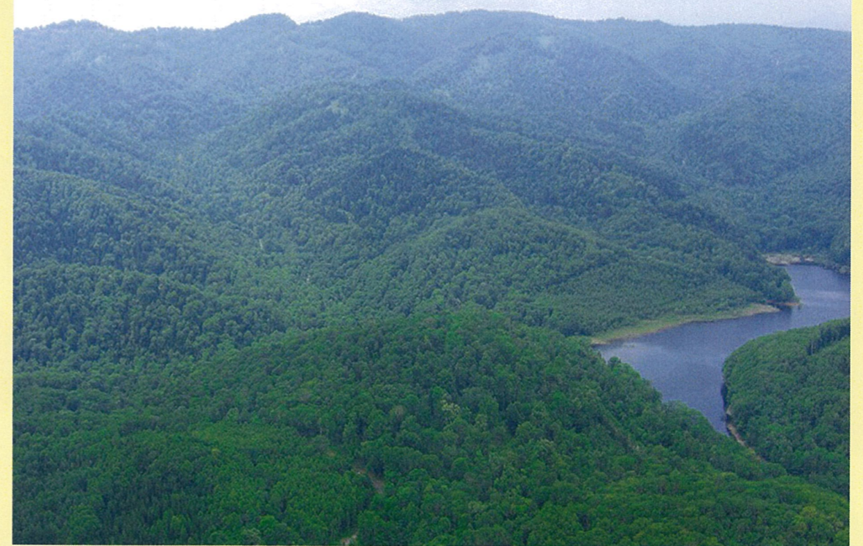
上川郡和寒町 国有林 2355 ~ 2357 林班 全景 (中和貯水池上流域)