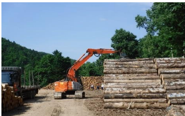
製品生産事業にて丸太の積み込み