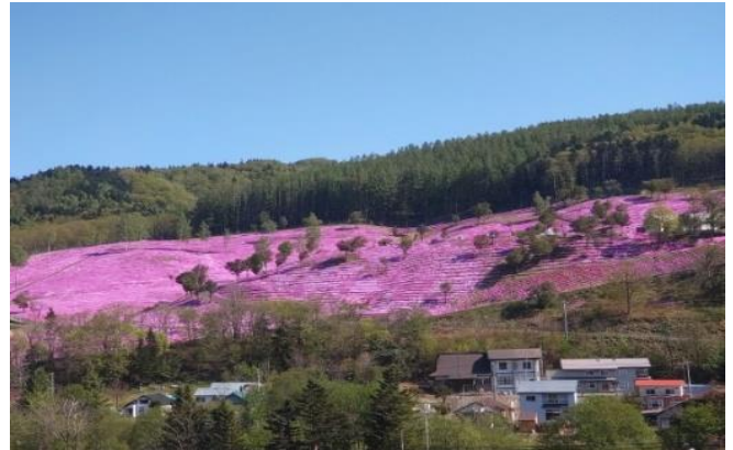
芝ざくら滝上公園

札久留森林事務所で行っている業務は多岐に渡ります。森林の状況を把握し、今後の森林施業の計画を立てるために必要な地林況調査、苗木の植付や植付した箇所の下刈りをする造林事業や木材の安定供給のため、森林を伐採して丸太を搬出する製品生産事業の監督業務、国有林と民有地の境界を確認する境界巡検、雪解けや大雨のあとの林道点検などを行っています。