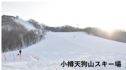
小樽天狗山スキー場

言われるとともに、ジャンプ台も設置され各種競技スキーのメッカとも言われてきました。