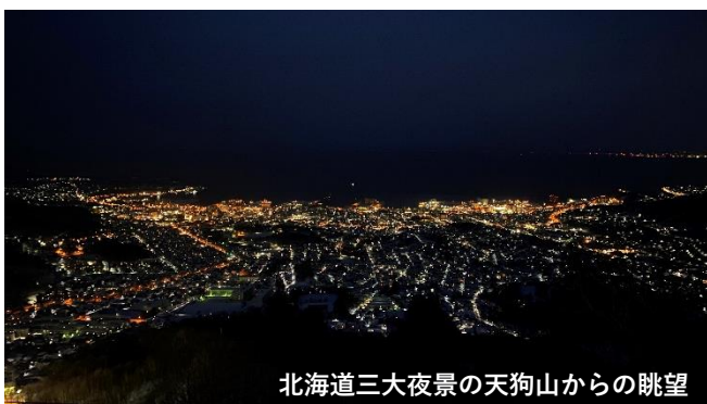
北海道三大夜景の天狗山からの眺望