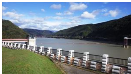
十勝ダムの東大雪湖

事務所のある新得町は、「北海道のどまんなか」にあたり、十勝川の最上流に位置し、町の大半は高山地帯で北部は2,000m級の山岳を有する森林地帯、南部は丘陵地帯でそば畑が広がります。人口は約5,500人で、農業・畜産業・林業を基幹産業とする町であり、観光面でもリゾート施設(サホロ)、秘湯トムラウシ温泉を始め、大自然を活かしたラフティングなどのアクティビティも豊富です。 また水資源が非常に豊富なため6つのダム、7つの水力発電所が稼働しています。