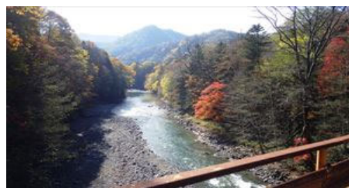
近別大橋からの紅葉と十勝川

が、エゾシカ狩猟期間も始まり適切な安全対策を取ることが大切になります。ニペソツ・トムラウシ管内は広葉樹も多いことから、将来的には理想の針広混交林を目指していければと思います。