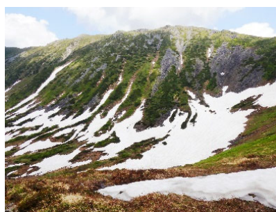
幌尻山荘ルート途中のカール

幌尻山荘から山頂までは4時間程ありますが、カール(氷河の侵食によって造られた場所)やお花畑等素晴らしい景色が楽しめますので、機会があれば挑戦してください。