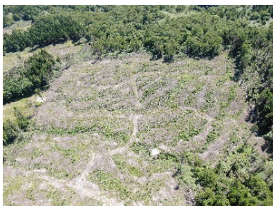
風倒被害地の再生状況 (令和2年度植栽)

倒被害が発生した人工林を再生すべく、被害木の整理から始まり、雑草や灌木等を取除く地拵という作業をした後に、苗木を植栽するまでを一貫して行う事業などを実施しており、今年度は約5haを予定しています。