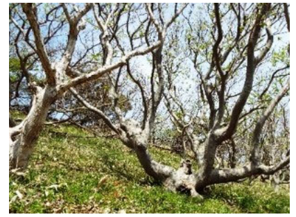
変形したケヤマハンノキ

が十分でなく、樹木などには厳しい環境というところもあり、緑化後の成長した木々には少し変わった