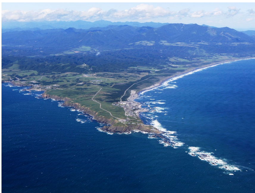
えりも風景林（えりも町）

えりも地区の海岸林は、明治時代の開拓時代に、森林の伐採や家畜の放牧で荒廃し砂漠化したため、地元の町や住民から緑化