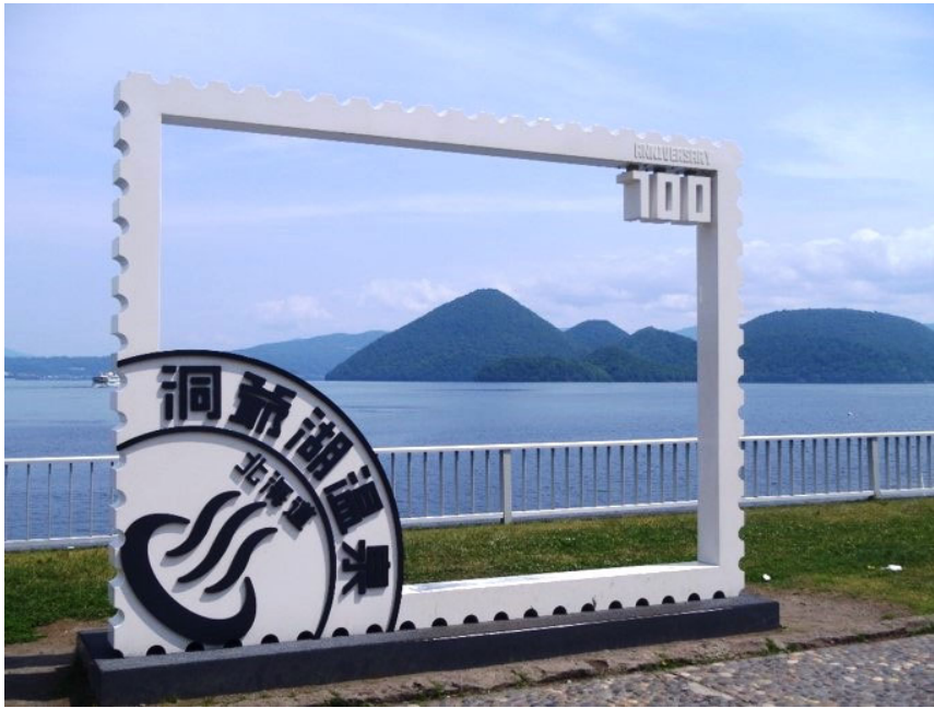
洞爺湖畔から中島を望む（洞爺湖町）

が十分でなく、樹木などには厳しい環境というところもあり、緑化後の成長した木々には少し変わった