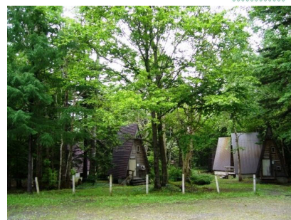
白金野営場（美瑛町）