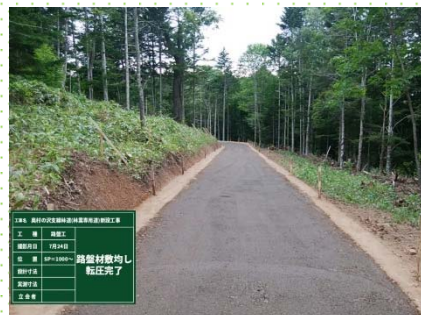
奥村の沢支線林道施工中

戦後に植栽した人工林が成熟しつつある中、きめ細やかな施業を実施し、資源の有効利用を図るためには、効率的な路網整備がさらに重要となります。林道は、地域の災害時の避難路としての役割も果たしており、北海道森林管理局では今後とも地域に貢献することができるよう、適切な維持管理に努めて参ります。