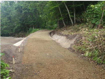
森姫川林道施工後