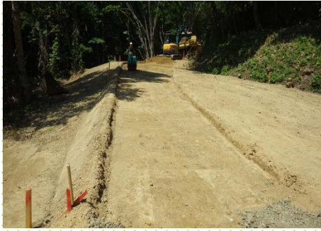
齊藤の沢林道施工中(路盤工)

齊藤の沢林道(林業専用道)新設工事は、約200haの森林施業を実施することを目的に1,570mを開設するものです。