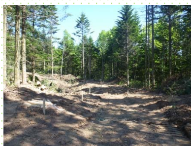
中ノ沢林道着手直後