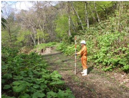
森姫川林道施工前

だけでは道路が造成できないこと、今後、同様の豪雨があった場合に土石流等の発生が見られることから、コンクリート擁壁を設置して路体の安定を図りました。工事は、7月下旬に完成しました。