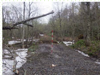
オマナイ林道施工前