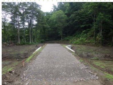
オマナイ林道改良後