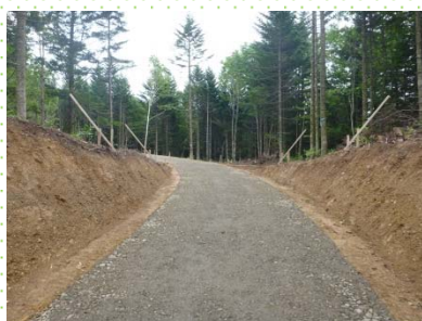
中ノ沢林道施工中