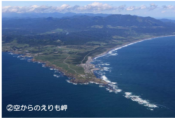
②空からのえりも岬

人をはじめとする生き物は、森に生まれ、森に守られて暮らしてきました。幾重にも連なる樹々の緑とふれあい、自然の息吹を肌で感じるとき、私たちの心に、新たな生命の力が芽吹いてくることを感じます。日本の国土の70%は、美しく豊かな森林につまれていきます。林野庁では、みなさまに広く森林に親しんでいただくべく、全国の国有林の中に「レクリエーションの森」を設定しています。