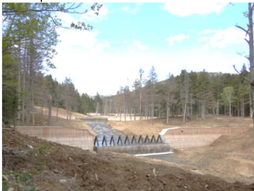
さる ひだか 沙流郡日高町 保全対象 国道274号