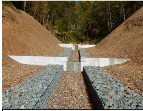
きたみ るべしべ 北見市留辺蘂 保全対象 国道39号