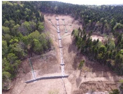
空知郡南富良野町 保全対象 道道夕張新得線