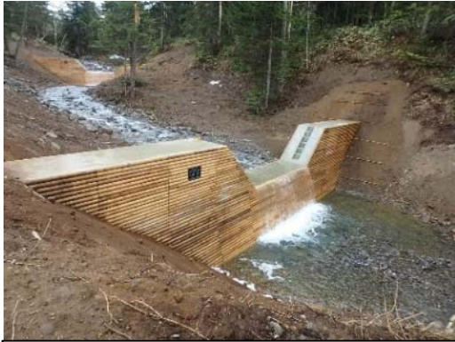
かみかわ びえい 上川郡美瑛町 保全対象 町道白金美瑛線