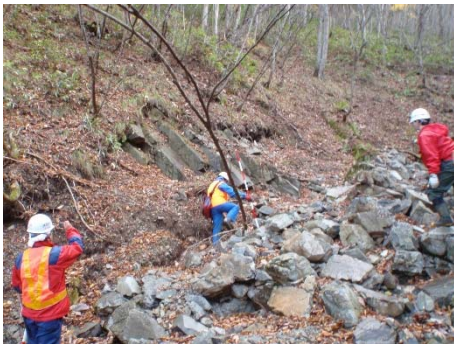
勉強会（現場）被災状況の把握