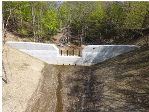
なかがわ ほんべつ 中川郡本別町 保全対象 道道本別本別停車場線