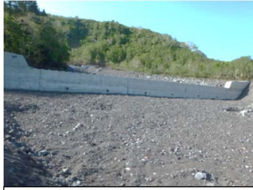
利尻郡利尻富士町 保全対象 道道沓形仙法志鴛泊線

地上調査とともにドローンを活用した調査を実施し、治山担当者のスキルアップと自己啓発に繋がりました。平成30年度においては、災害申請時の緊急的な調査・設計について、職員自らが測量、設計を行い災害申請資料一式を作成可能となるよう、昨年と同様に振興局職員も招き治山勉強会を実施する予定です。