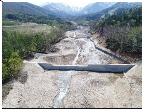
かみかわ しみず 上川郡清水町 保全対象 農地等