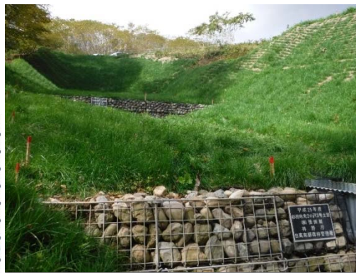
新冠郡新冠町 保全対象 畜産施設