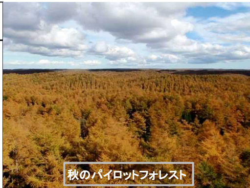
秋のパイロットフォレスト

1957年(昭和32年)から植栽が始まり、森林の造成には10年間で延べ44万人が動員されました。現在では湿原を除くほぼ全域がカラマツ人工林を主体とする森林で占められています。