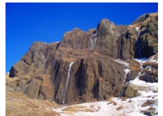
落石防止網工の施工箇所

礼文島は、その独特な地形のため、頻りに雪崩が発生したり、風化した岩壁が落石となったりしますので、各種災害を防ぐよう、雪崩防止柵や土留め工、落石防止網工が施工されています。