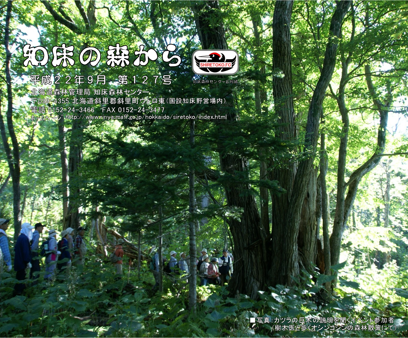
■写真:カツラの巨木の説明を聞くイベント参加者 (樹木医と歩くオシンコシンの森林散策にて)

北海道森林管理局 知床森林センター 〒099-4355 北海道斜里郡斜里町ウトロ東（国設知床野営場内） 電話 0152-24-3466 FAX 0152-24-3477 ホームページ http://www.rinya.maff.go.jp/hokkaido/siretoko/index.html