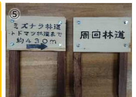
写真1 看板の作成手順