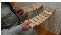
鍵盤間に小木球を挟んだ実験の評価について

吊り橋に見立てた鍵盤間に小木球1個をはさみ接触面積を減らし音の改善を図った。できあがった吊り橋は2段にして、見た目が良く木球速度が適正である位置に固定した。