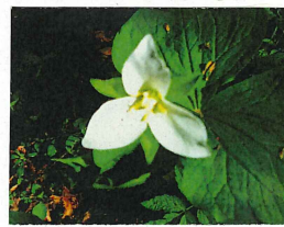
オオバナエンレイソウ