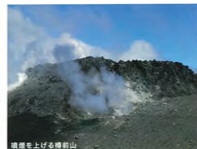
噴煙を上げる樽前山

新千歳空港や札幌、苫小牧西港フェリーターミナルからも比較的アクセスやすく、四季折々に表情を変え、大自然の生命の息吹を伝えるかのような迫力に満ちたインクラの滝の飛瀑は、訪れる者を魅了します。 また、近隣にはアイヌ文化に触れることができる国立アイヌ民族博物館・国立民族共生公園(2020年開園予定)や登山道の整備された樽前山、採れたての食材が楽しめる豊富なグルメスポット、道内最大級の湯量を誇る虎杖浜(こじょうはま)温泉等、多くの観光名所が揃っています。グルメを楽しみたい方は、世界のVIPも絶賛した深いコクとまろやかな味わいで有名な白老牛を、町内のレストラン等でリーズナブルに食べてみてはいかがでしょうか。