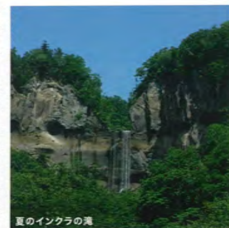
夏のインクラの滝

胆振地方の気候は、北海道の中では比較的温暖です。春の訪れは早く、夏は涼しく、秋は爽やかで安定した日が続きます。 樽前山の過去の噴火で積もった厚い火山灰の地層を、長い時間をかけて通り抜けてきた伏流水は、清冽で水量も豊富です。周囲の崖や渓谷にはエゾマツ、トドマツ等の常緑樹やナラ、イタヤ、カツラ、ニレ等が生育し、澄んだ水面に四季それぞれの色彩を映しだしています。