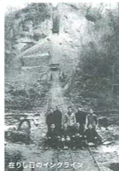
在りし日のインクライン

社台台上には、エゾマツ、トドマツ、ミズナラ等の木材を急な崖の下に運搬するためのインクラインが設置されていたことから、「インクラの滝」の名がついたともいわれています。(* 荷を積んだトロッコが自重で下りる力を利用した、空のトロッコを引き上げる装置。インクラインの操作は難しく、1944年に廃止、撤去されたのを機に、木材の運搬には林道を利用しています。)