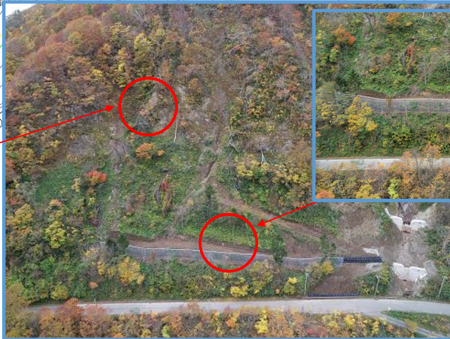
落石防護柵工完成