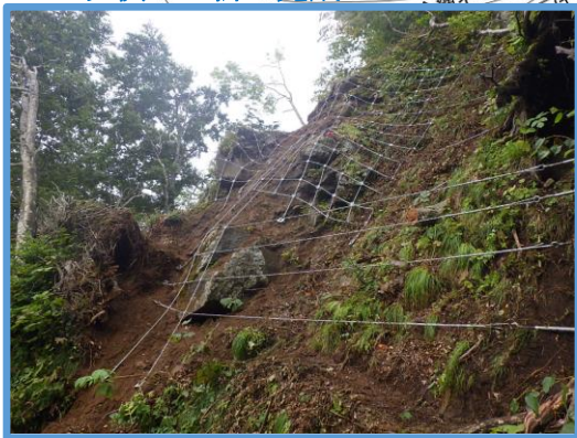
ロープ伏工・掛工完成