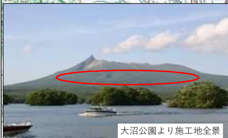
大沼公園より施工地全景